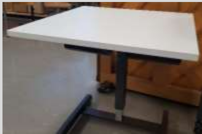
Schülertisch. höhenverstellbar. rollbar.

Sämtliche Klassenzimmer und Schulräume werden mit neuen Schulmöbeln für die Schüler*innen ausgestattet. In Gruppen- und Fachräumen werden teilweise noch vorhandene Arbeitstische und Sitzgelegenheiten weiterverwendet. In Zukunft sollen höhenverstellbare Einzelarbeitsplätze und ergonomische Sitzgelegenheiten zur Verfügung stehen. Zusammen mit flexibel einsetzbaren Gruppentischen können Unterrichts- und Lernsettings in Zukunft den jeweiligen Bedürfnissen relativ einfach angepasst werden. Einige alte Lehrerpulte sollen durch Steh-Arbeitstische ersetzt werden. Die Beschaffung und Lieferung des neuen Schulmobiliars sind in der ersten Hälfte des Kalenderjahres 2021 geplant.