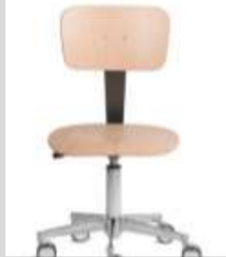
Schülerstuhl. höhenverstellbar. Mit Fussring.